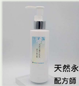
天然永續全效乳 配方師：陳祁樹慎