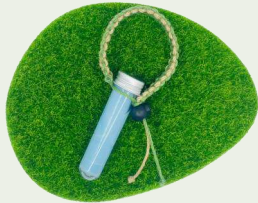
1312 試管面膜 沖散您悶壞的肌膚-自然分解一把罩 配方師：侯冠宇 莊靜怡 詹依璇 楊帝全