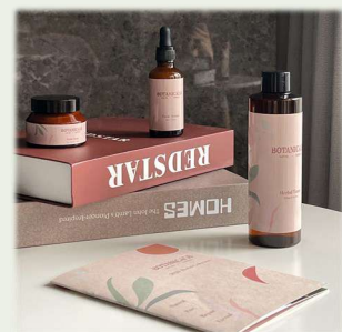
鼠尾草系列-鼠尾草純粹化粧水、 鼠尾草活萃精華、鼠尾草活膚面霜 靜宜大學化粧品科學系 古婉伶 林弘哲