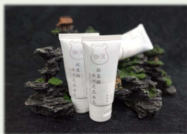
微泥胺基酸冰河泥洗面乳 嘉南藥理大學化粧品科技研究所 林昆賢 林珮筠 張俊麟