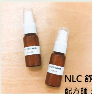
NLC 舒敏修護噴霧 配方師：林志青