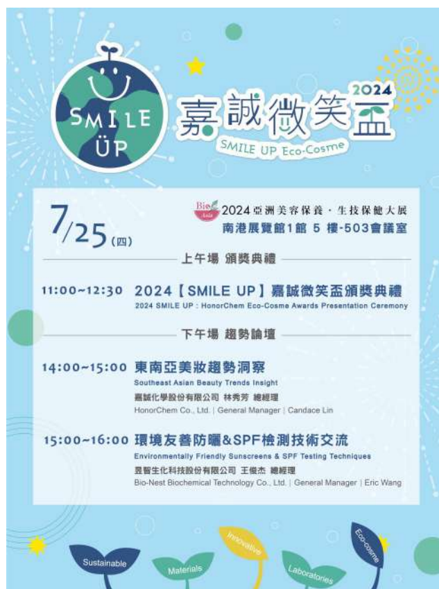
▲ (圖七) 2024 SMILE UP嘉誠微笑盃頒獎典禮暨產業趨勢論壇議程

第二場論壇則邀請昱智生化（Bio-Nest）王俊杰總經理，針對熱門環境友善議題，分享「 環境友善防曬 & SPF 檢測技術交流 」，並以昱智生化專業研發技術與產業視角探討環境友善。同時針對 SPF 檢測技術的盲點，親自與業界同仁進一步交流。嘉誠攤位現場亦有展出昱智生化 2 支以獨特包覆技術，且因應環境友善研發的「 包覆型化學防曬劑 」： SunCat JCW03 及 SunCat JCW09 。除了讓各位業界先進們了解防曬劑的檢測方式，同步也可以直接一覽昱智生化的防曬劑原料，並體驗由嘉誠提出的防曬解決方案。