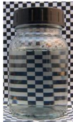
12% SLES/CAPB 10% Plantasil® Micro