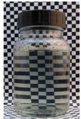
12% SLES/CAPB 25% Plantasil® Micro

添加高比例的Plantasil® Micro 於洗髮水配方，仍能保持高度透明，且易於添加進入配方中，無沉澱及混濁情形。