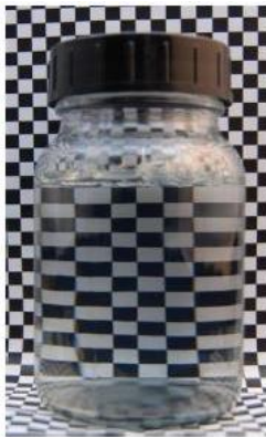
12% SLES/CAPB 1% Plantasil® Micro