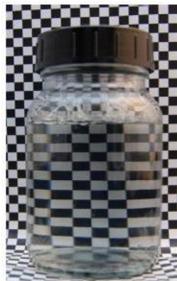
12% SLES/CAPB 5% Plantasil® Micro