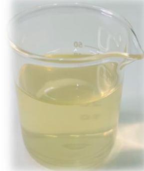
▲ Sirayash Plantix® Mala' afihay 粟米粹