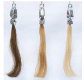
MB 1 x UB 3 x UB

MB : Medium Bleached ( 中度漂白 ) 1xUB : 1 time Ultrableached ( 1次深度漂白 ) 3xUB : 3 times Ultrableached CaucasianHair ( 3次深度漂白 )