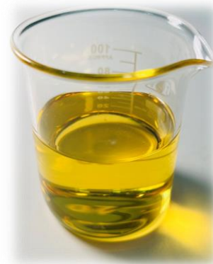
▲ Sirayash Plantix® Hafay 狐尾粟精粹