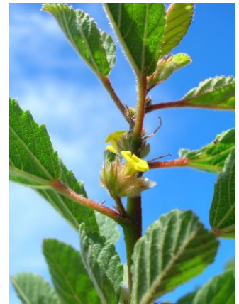
↑ 印度蛇婆子 (Waltheria Indica)