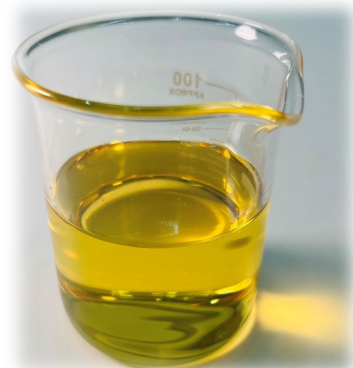
▲ Makatta Simal® Varu 金蕊白椿油