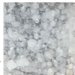
▲ 雪花般的劑型特色

米糠精粹含有 抗氧化維生素E 、 穀維素 及 維生素B1 ，是款具有極高熱穩定及光穩定的活性油脂，兼具優異的抗氧化能力，除了一般化粧品應用，也適合應用在 熱製 的彩妝品。而油膏狀的米糠精粹添加於化妝水配方中，可呈現出 雪花般 的特色。米糠精粹能在化粧品保養品上進行多重劑型變化，達到 應用面最大化 （保養品、彩妝、髮品）的效果。